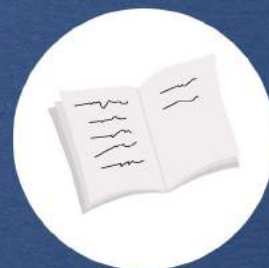
ЗОШИТИ для вправ