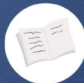
zeszyty do ćwiczeń